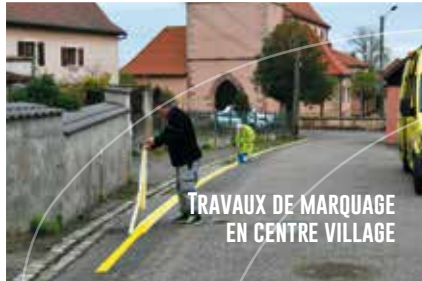
TRAVAUX DE MARQUAGE EN CENTRE VILLAGE