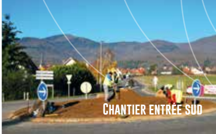
CHANTIER ENTRÉE SUD