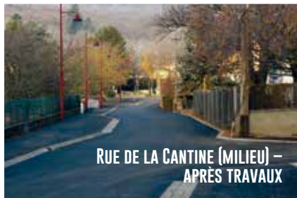
RUE DE LA CANTINE (MILIEU) – APRÈS TRAVAUX