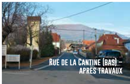
RUE DE LA CANTINE (BAS) – APRÈS TRAVAUX