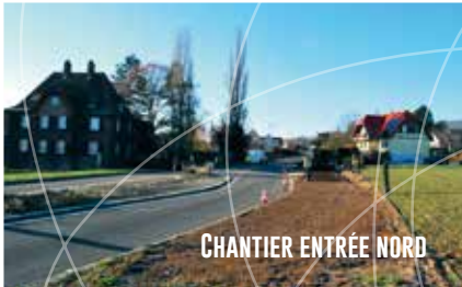
CHANTIER ENTRÉE NORD