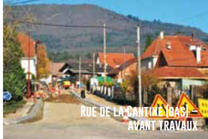
RUE DE LA CANTINE (BAS) – AVANT TRAVAUX