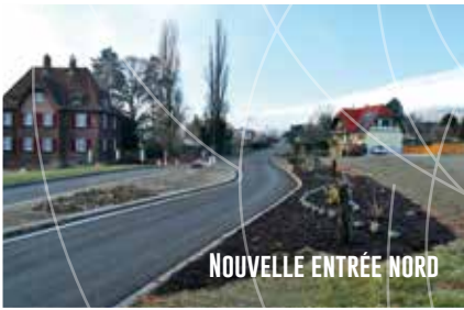
NOUVELLE ENTRÉE NORD