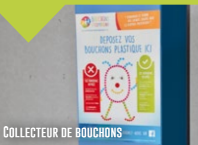
COLLECTEUR DE BOUCHONS

Depuis le 19 juin dernier, l'association Bouchons et compagnie met à votre disposition un collecteur de bouchons en plastique au rez-de-chaussée de la Mairie. En déposant vos bouchons vous participerez à l'amélioration du quotidien des enfants malades (financement d'équipements et de projets).