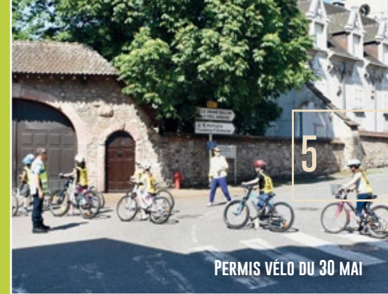
PERMIS VÉLO DU 30 MAI

Avec le retour des températures estivales, la tentation est grande de se rafraîchir dans les fontaines. Faut-il rappeler qu'une fontaine n'est pas une piscine ? La baignade n'est pas sans risques. Outre les chutes, noyades ou encore blessures dues aux morceaux de verre dans le fond des bassins, le principal danger, invisible, tient à la qualité de l'eau qui n'est pas traitée. L'été est la pire période car la température est optimale pour le développement des bactéries, notamment les légionelles qui se développent dans une eau à 20-45° et qui peuvent être très dangereuses. Et maintenant, on se choisit de belles vacances au lieu de les passer au fond d'un lit d'hôpital !